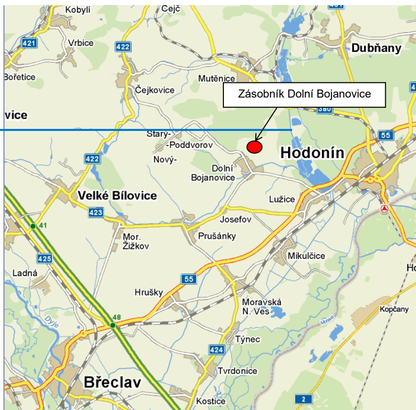
Obr. č. 1: Geografické umístění Zásobníku

Okomentoval(a): [IP1174]: Dáváme ke zvážení, zda je nutné mít grafické vyobrazení.