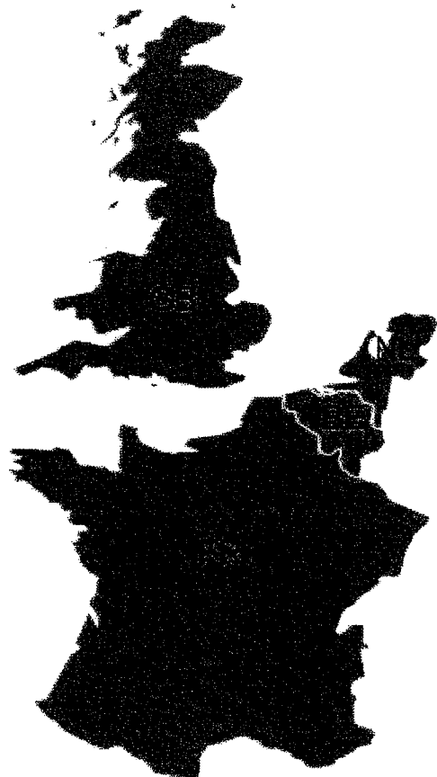
Mapa 1: Channel CCR